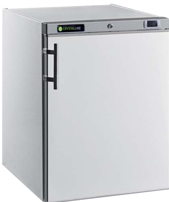
MAC185 PO BL