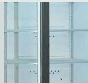
Iluminación interior mediante fluorescentes verticales interiores. Modelo EIS 40.3 BT mediante led.