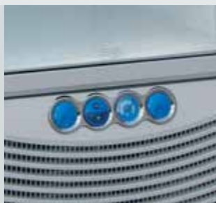
Control de temperatura mediante termostato regulable.