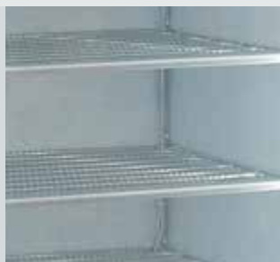
Estantes en acero plastificado blanco.