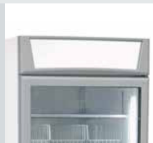
Display luminoso superior con posibilidad de personalización.