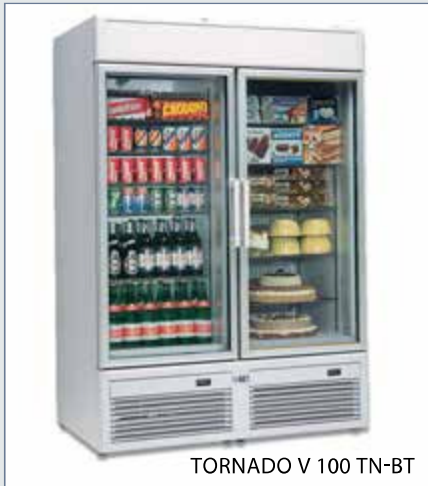
TORNADO V 100 TN-BT