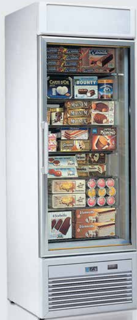
TORNADO S40 BT