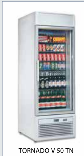
TORNADO V 50 TN