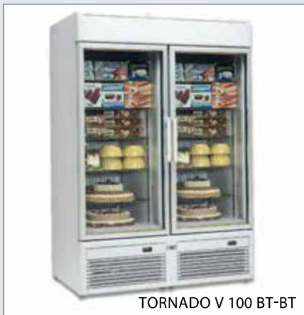
TORNADO V 100 BT-BT