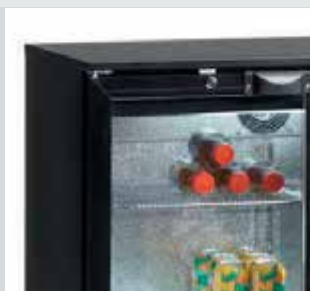
Armario con estructura y marco de la puerta negro.