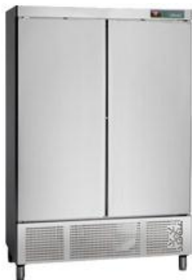
Horeca - Armarios refrigerados - Gama Classic Snack - Positivos